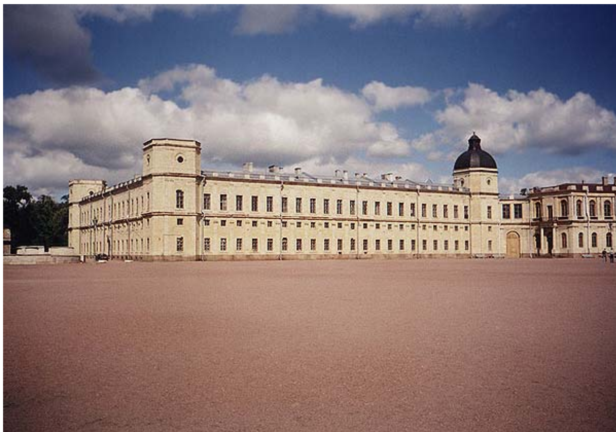
Pavlovo sídlo v Gatčině. Prostor před zámkem byl místem přehlídek a nástupů jeho miniarmády.

Jako velkoadmirál měl Pavel pochopitelně nárok na osobní stráž. K tomu „ velkoadmirálsství “ dostal tedy mladý následník oddíl, do kterého vyslaly čtyři flotské bataliony /o těch bude řeč při popisu speciálních jednotek/ čety o třiceti mužích. Kasárna strážního oddílu byla v té době na Kamenném ostrově. Když se mladý následník vrátil v roce 1783 z Berlína – pobýval tam u vzdáleného příbuzného ( tím pochopitelně nebyl nikdo jiný, než Friedrich II., pruský král ) - věnovala mu carevna zámek a panství Gatčinu jako sídlo „ malého dvora “. Tam začal následník, okouzlený pruským pořádkem, budovat své malé impérium.