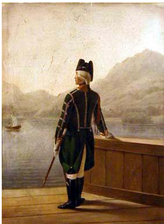
Obr.č.9 – štábní hornista mysliveckého pluku

Popisem stejnokrojů hudebníků mysliveckých pluků bych tuto kapitolu mohl ukončit. To bychom ovšem nesměli mluvit o armádě cara Pavla. Na konci roku 1800, kdy konečně všechny myslivecké pluky dokončily do té doby nařízené změny svých stejnokrojů, přišla další – tentokrát dost podstatná – změna. Bílé úzké kalhoty byly zaměněny kalhotami pěchotního střihu ze světle zeleného sukna, letní plátěné kalhoty zůstaly sice bílé, ale dostaly také pěchotní střih. Změna se týkala i bot – polovysoké holínky byly nahrazeny vysokými a myslivci do nich navlékali stejné „štýbletmanžety“ jako jejich důstojníci, sloužící v sedle. Řemeny k tornám se měly napříště zhotovovat z nebarvené losí kůže ( blíže o tom v kapitole o výzbroji ). Není známo, kolik z tehdy existujících devatenácti mysliveckých pluků stihlo do konce Pavlova panování tyto změny stejnokrojů provést – v roce 1802 už bylo všechno opět jinak!