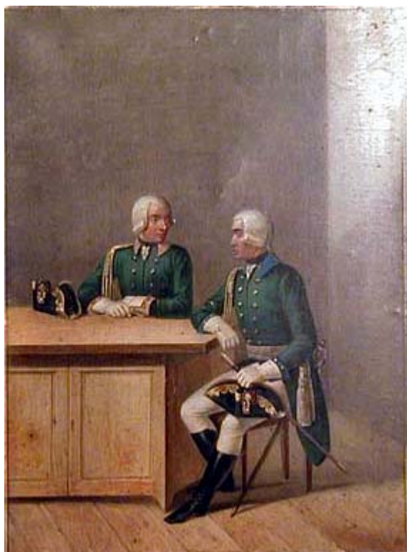
obr.4 – důstojníci mysliveckých pluků