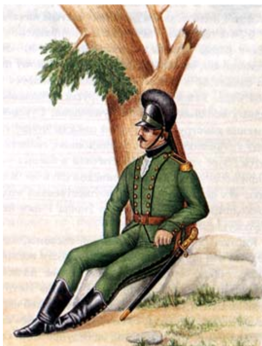
Obr.1 – „kateřinský“myslivec (1795)

Myslivci byli až do roku 1777 nedílnou součástí pluku řadové pěchoty, v jehož řadách tvořili myslivecký oddíl. V tomto roce byly myslivecké oddíly od pěších pluků vyčleněny ke zformování samostatných mysliveckých batalionů, ze kterých byly stavěny, v případě potřeby, i vyšší jednotky—např. Bugský myslivecký sbor. V armádě knížete Potěmkina byl v roce 1790 postaven dokonce granátnický pluk lehké pěchoty ( o jeho organizaci toho ale vím poměrně málo ). Postupem času byla organizace ujednocena na počtu 43 mysliveckých batalionů, které byly ovšem, nedlouho před nástupem Pavla I. na trůn redukovány na počet 20-ti mysliveckých batalionů, každý o pěti rotách. Takový je tedy výchozí stav v době, o které mluvíme.