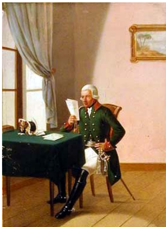
obr.5 – generál mysliveckého pluku

Důstojnické kabátce se od kabátců mužstva lišily pouze kvalitou použitého sukna. Na rozdíl od svých pěchotních kolegů nosili šosy převrácené a sepnuté . Pod černým nákrčником ( stejný nosilo i mužstvo ) je vidět bílá, našasená náprsenka. Jak je u pavlovských uniforem obvyklé, generálský kabátec se ani v detailech nelišil od důstojnického (viz obr.5). Střih vesty byl shodný s vestou pěchotního stejnokroje, také pravidla jejího nošení ( párání a přišívání rukávů ) byla stejná. Barva sukna však odpovídala barvě kabátce-myslivecká vesta byla zelená! Pohodlné úzké kalhoty uherského střihu-tzv. „šakširy“-to bylo to jediné, co z původních stejnokrojů myslivcům zbylo. Změnila se pouze barva kalhot-ze zelené na „vševojskovou“ bílou. V počáteční fázi pavlovské reformy se kalhoty šily z jelenice nebo kozlečiny-později se přešlo na méně nákladné provedení: zimní kalhoty byly šity z bílého sukna, letní z vlámského plátna. Na pochodech a v boji oblékali myslivci návlekové kalhoty šité z hrubého plátna, většinou přírodní barvy. Kalhoty byly zasunuty, u mužstva, poddůstojníků a také většiny důstojníků, do polovysokých holinek z měkké kůže. Pouze důstojníci sloužící v sedle-adjutanti, plukovníci a generálové-nosili vysoké jezdecké boty. V tom případě navlékali na kolena tzv. „štýbletmanžety“-návleky z bílého plátna. Jejich účelem bylo chránit sukno kalhot před odíráním o hranu kožené manžety jezdecké boty ( dobře patrné jsou na obr.6 ).