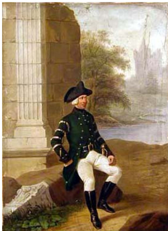
obr.č.8 – rotní hornista

Zbývá zmínit se ještě o dvou kategoriích mysliveckého mužstva – o neřadových příslušnících pluku a o hudebnících. Neřadové mužstvo a poddůstojníci nosili plukovní stejnokroje, pouze v poněkud chudším provedení- na pravém rameni chyběla ozdobná šňůra. Jedna výjimka se vyskytla – na obr.7 stojící poddůstojník je nadvozným pluku. Na jeho stejnokroji tato ozdoba nechyběla! Sedící je buď jedním z řemeslníků nebo plukovní písař. Až na zmíněný „achselbant“ má všechny atributy poddůstojnické hodnosti: lemování hrany límce a manžet, rukavice s manžetou a někde za ním je určitě položena poddůstojnická hůl . Rukavice pochopitelně patřily i ke stejnokroji řadových poddůstojníků a důstojníků.