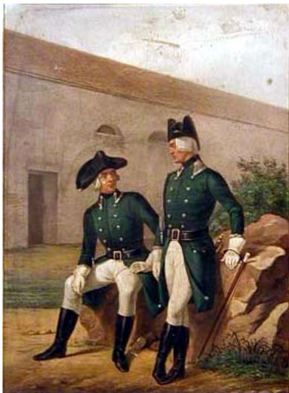
obr.č.7 – neřadoví poddůstojníci mysl.pluku

funkce ozdobně zapletená náramenní šňůra v barvě knoflíků pluku. A protože u mysliveckých stejnokrojů byla stejná šňůra standardním doplňkem důstojnického kabátce, jde v případě obšití manžet a límce páskou v barvě knoflíků pluku o označení adjutantské funkce. To je však pouze můj názor-pátrám dále. Krom už zmíněného zdobení klobouku byly jediným označením důstojnické hodnosti šerpa a hůlka (tu ale, na rozdíl od poddůstojníků, nosili důstojníci pouze mimo službu). Náhrudní důstojnický štítek byl u mysliveckých pluků zrušen v roce 1797. Mužstvo nosilo do nepohody pláštěnku (popsanou už u pěchoty) a v zimním období oblékali myslivci kabát pěchotního střihu z tmavozeleného sukna, zapínaný na suknem obšité knoflíky. Ležatý límec v plukovní barvě na mysliveckých kabátech nebyl! Důstojníci nosili v zimě a do nepohody převlečník a plášť určený důstojníkům pěchoty. Veškeré osobní věci nosili vojáci a poddůstojníci v torně pěchotního typu. Torna se nosila na levém boku, veškeré řemení (včetně řemínku polní láhve) bylo černé . O nábojových brašnách bude řeč v kapitole o výzbroji.